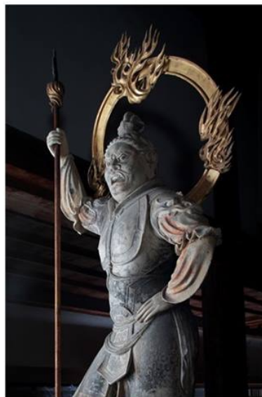
Zōjō-ten / Virūdhaka (Um dos Quatro Reis Guardiões Caturmahārāja), no Templo Tōdai-ji, Tesouro Nacional do Japão, século VIII.

Organização: Consulado Geral do Japão no Rio de Janeiro Apoio: Setor de Japonês da UERJ e Global Japan Office da TUFS